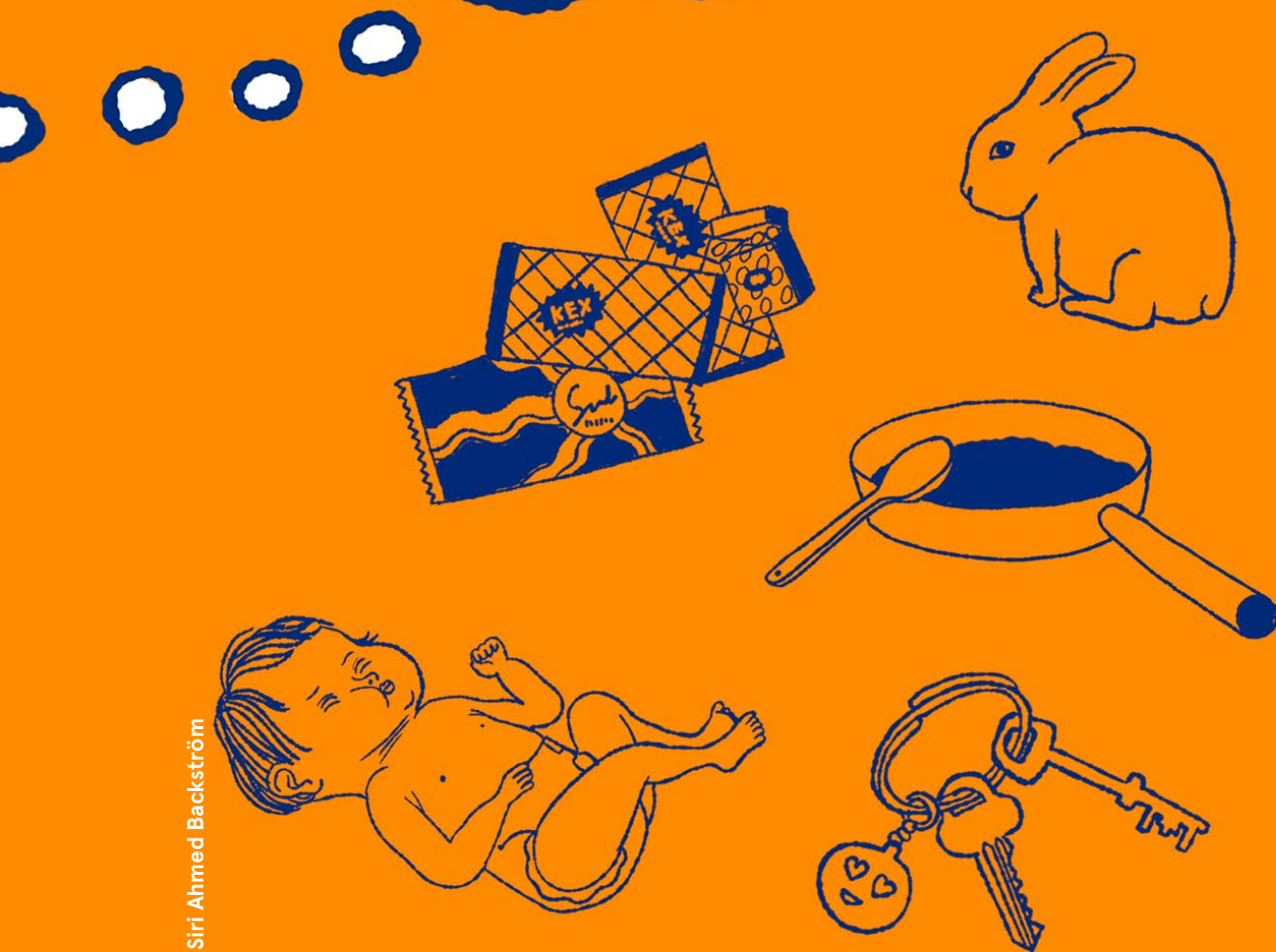
Illustration: Siri Ahmed Backström