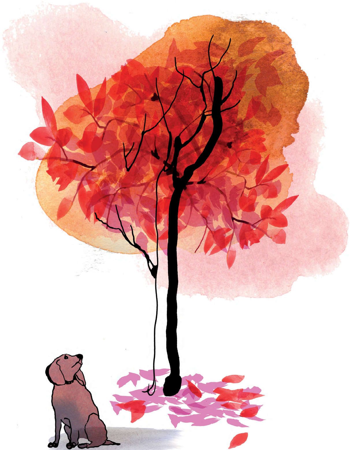
Illustration: Stina Wirsén