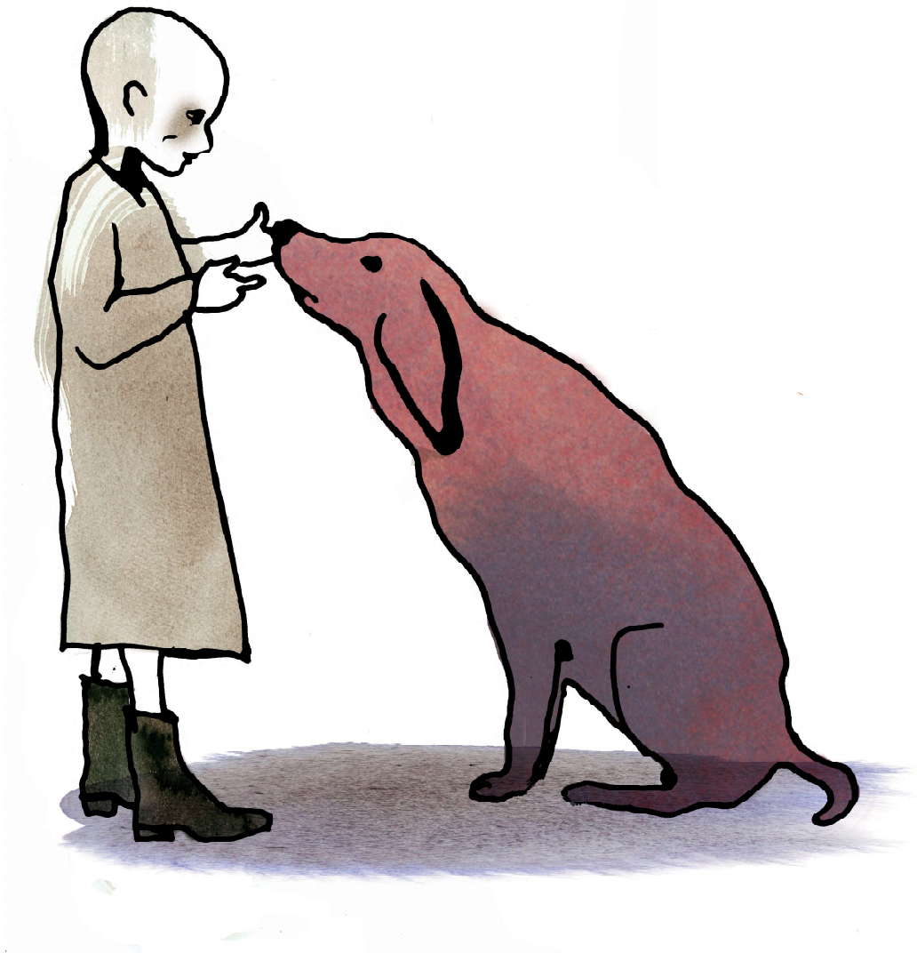
Illustration: Stina Wirsén