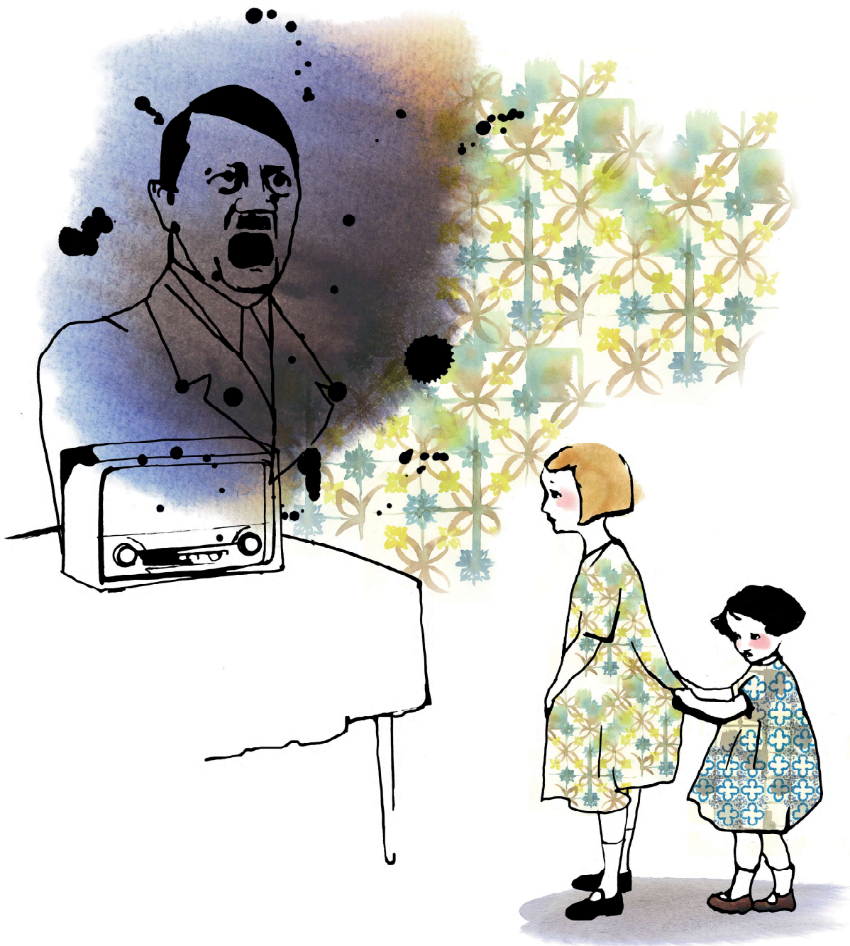
Illustration: Stina Wirsen