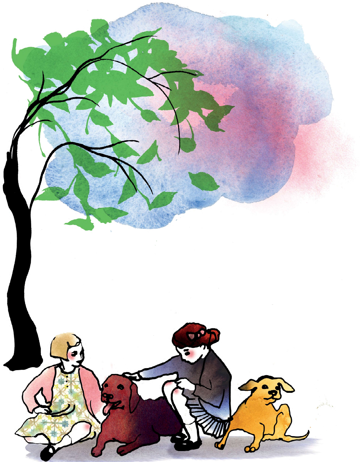
Illustration: Stina Wirsen