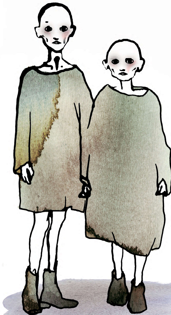
Illustration: Stina Wirsen