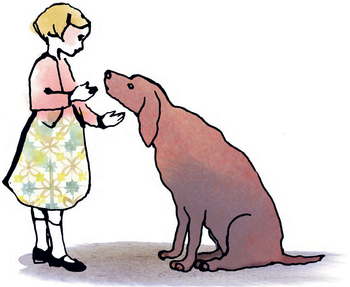
Illustration: Stina Wirsen