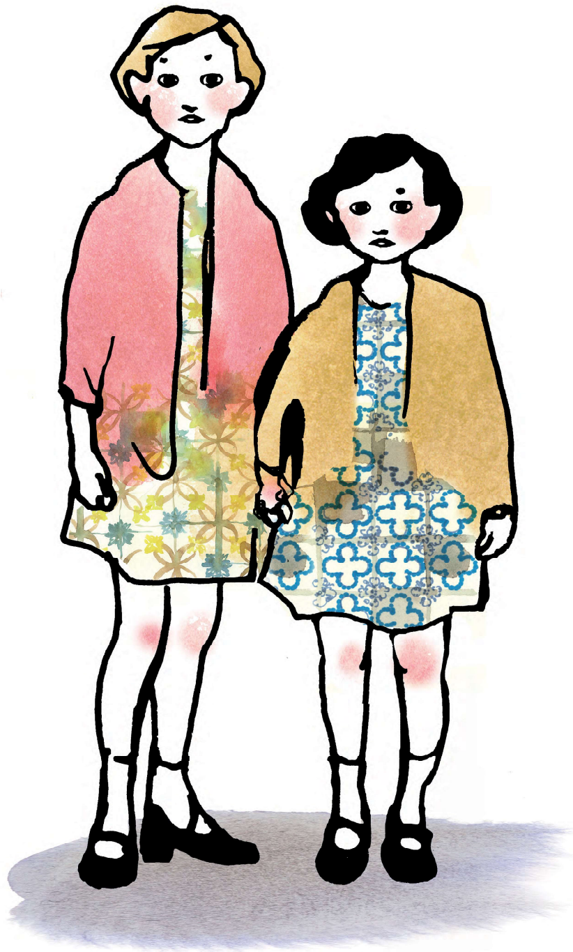
Illustration: Stina Wirsen