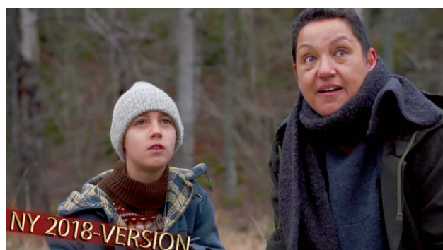
4. Hundra år i Sverige