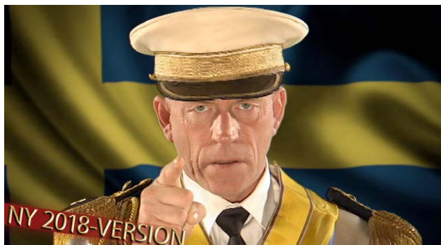
1. Att rösta