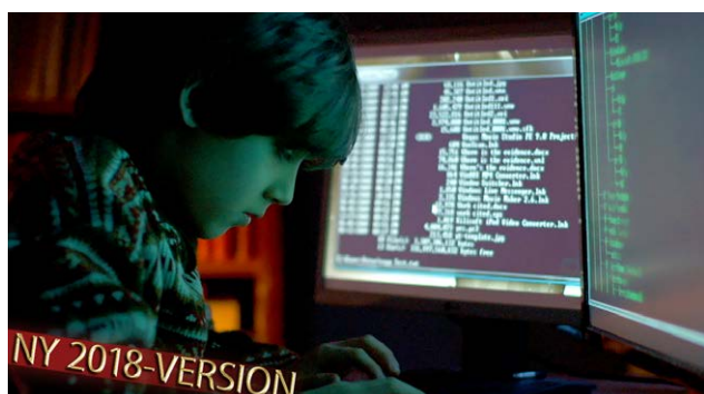
5. Utanför systemet