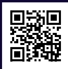
Länk till känslor- klippen