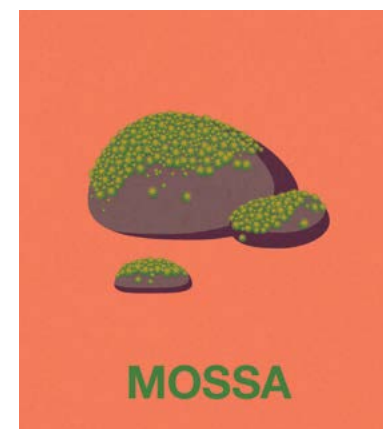
Illustration: Joakim Agervald

Klicka här för att komma till Galonisarna och det pedagogiska materialet på UR Play