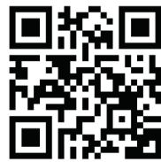
Galonisarna – Snigel och Snäcka